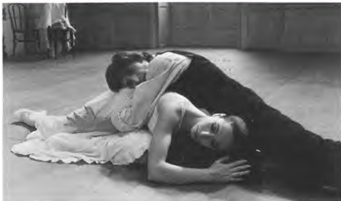
Antonio Gades – Cristina Hoyos